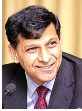
आहे, ती पुरेशी नाही. सरकार भविष्यात प्रोत्साहन पॅकेज देण्यासाठी आज साधन

अर्थव्यवस्थेला अमेरिका आणि इटलीपेक्षा अधिक नुकसान झाले आहे. हे दोन्ही देश कोरोनामुळे सर्वाधिक प्रभावित झालेले आहेत. अमेरिकाचा विकास दर १२.४ टक्के तर इटलीचा ९.५ टक्के घसरला आहे. जोपर्यंत कोरोनावर नियंत्रण मिळवले जात नाही तोपर्यंत भारतात खर्च करण्याची परिस्थिती कमकुवत असेल. आतापर्यंत सरकारने जितकी मदत केली